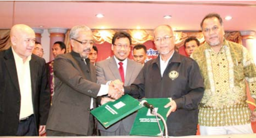
Memorandum Persefahaman dimeterai disaksikan oleh Exco Negeri Kelantan.