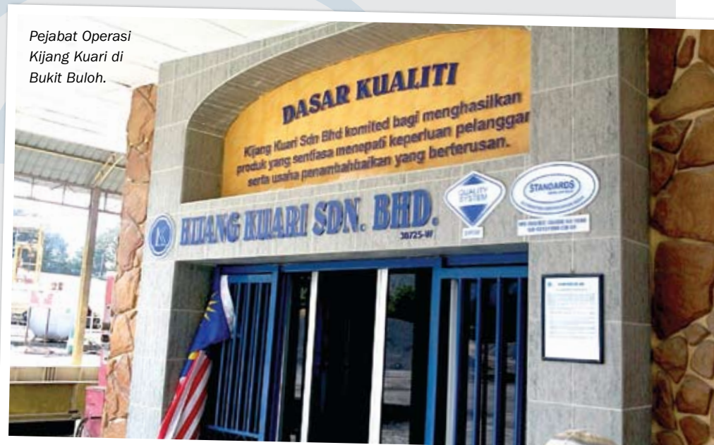
Pejabat Operasi Kijang Kuari di Bukit Buloh.

“Saya mengambil pendekatan terhadap supplier yang bermasalah dengan menamatkan kontrak mereka