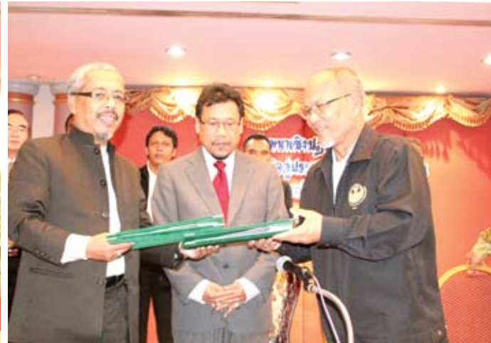
MoU antara KPKB dan STICON dimeterai baru-baru ini.