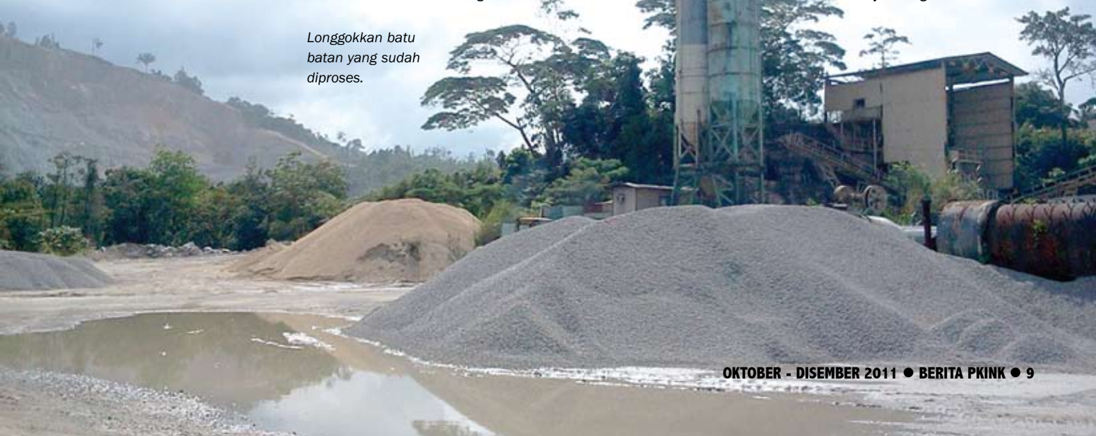
Longgokkan batu batan yang sudah diproses.

Bagi meningkatkan lagi keuntungan syarikat, Kijang Kuari kini sedang mempelbagai skop kerja dengan menceburi