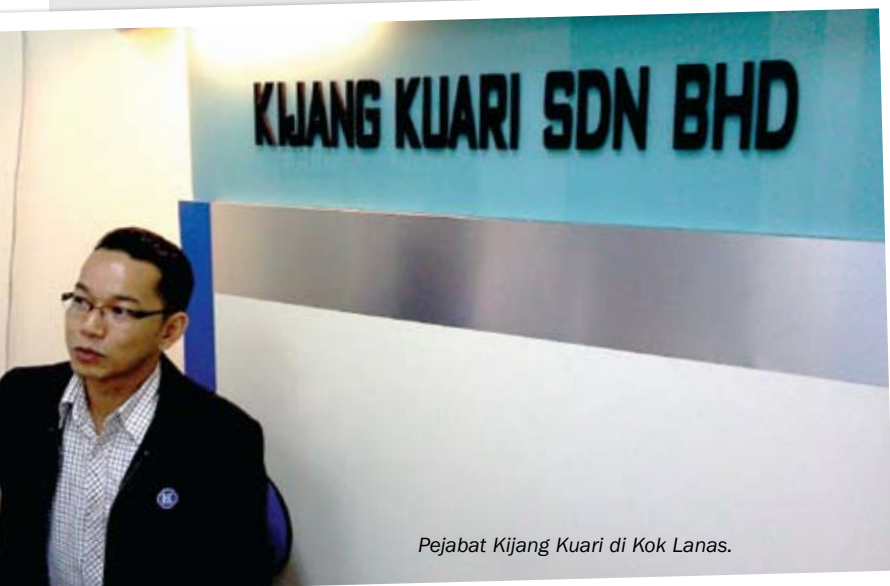
Pejabat Kijang Kuari di Kok Lanas.

Kini Kijang Kuari Sdn Bhd telah menjadi sebuah syarikat yang mampu berdiri seiring dengan anak syarikat lain dalam Perbadanan Kemajuan Iktisad Negeri Kelantan dalam usaha membantu kerajaan negeri meningkatkan pendapatan negeri. 🍌